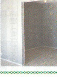
▲見学した室内の様子

受け継いだ土地を後世に残し、さらに原家に受け継がれてきた既存樹や庭石などを活かした住まい作りを構築しました。こうしたコンセプトに共感する方への永住型賃貸レジデンスを提案しています」と語った。 外観デザインは旧原家屋敷をモチーフにした大きなひしきを用いている。1階ラウンジには歴史ギャラリーを