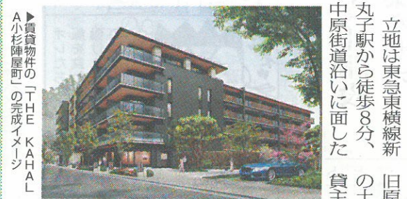
▲賃貸物件の「THE KAHALA小杉陣屋町」の完成イメージ

原マネージメント（神奈川県川崎市）と三井不動産リアルティ（東京都千代田区）は、今年6月にランドオープンする「ゲートスクエア小杉陣屋町」の概要を発表した。「ゲートスクエア小杉陣屋町」は、賃貸マンションと分譲マンションを併設し、約900㎡の中庭やギャラリー、ドッグパークなども入る。